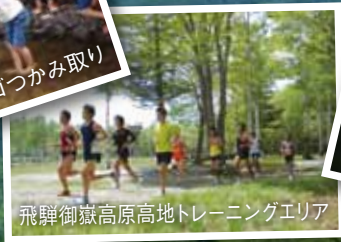
飛騨御嶽高原高地トレーニングエリア