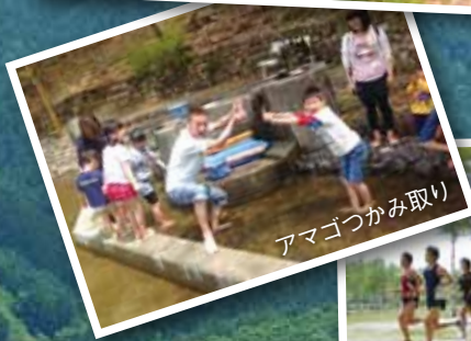
アマゴつかみ取り