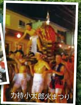
力持小太郎火まつり