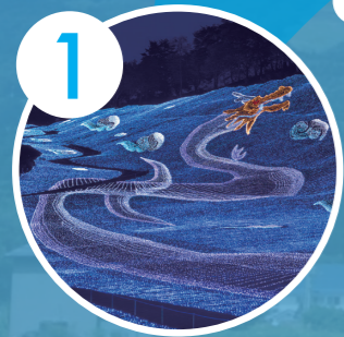
1 妙高ハピネスイルミネーション

日本百名山・妙高山のすそ野に広がる「妙高戸隠連山国立公園」の雄大な自然と、7つの温泉地・5つの泉質・3つの湯色を誇る妙高原温泉郷が輝く「高原リゾート 妙高」。色鮮やかな妙高の秋、大パノラマの紅葉と多彩な美肌の湯をめぐるスタンプラリーをお楽しみください！