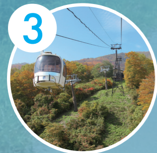
3 妙高原スカイケーブル