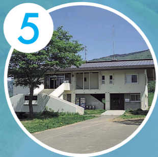
5 笹ヶ峰グリーンハウス