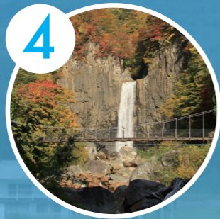
4 日本の滝百選・苗名滝