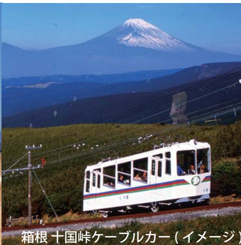
箱根 十国峠ケーブルカー(イメージ)