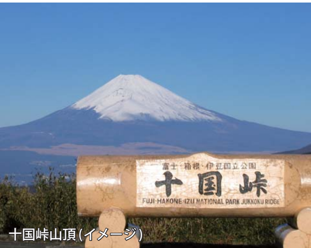
十国峠山頂(イメージ)