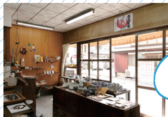
可愛いマグネット

店内を覗いてみると文具に加えて和雑貨や小物がズラリ。お気に入りが見つかりそうな予感。もみじまんじゅうをはじめ、可愛い和菓子の正体はマグネット。瀬戸内レモン紅茶やしゃもじハガキなど店主のセンスが光る雑貨達に心躍ります。